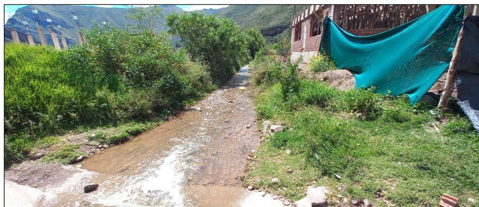
FIGURA N°02: TRAMO CRÍTICO EN LA QUEBRADA MISKIHUAYCO, DISTRITO DE COYA, PROVINCIA DE CALCA - CUSCO, SE APRECIA EL CAUCE COLMATADO.