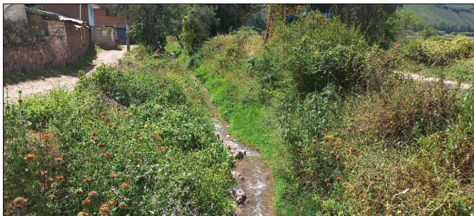
FIGURA N°01: TRAMO CRÍTICO EN LA QUEBRADA MISKIHUAYCO, DISTRITO DE COYA, PROVINCIA DE CALCA - CUSCO, SE APRECIA EL CAUCE COLMATADO Y LLENO DE VEGETACION.